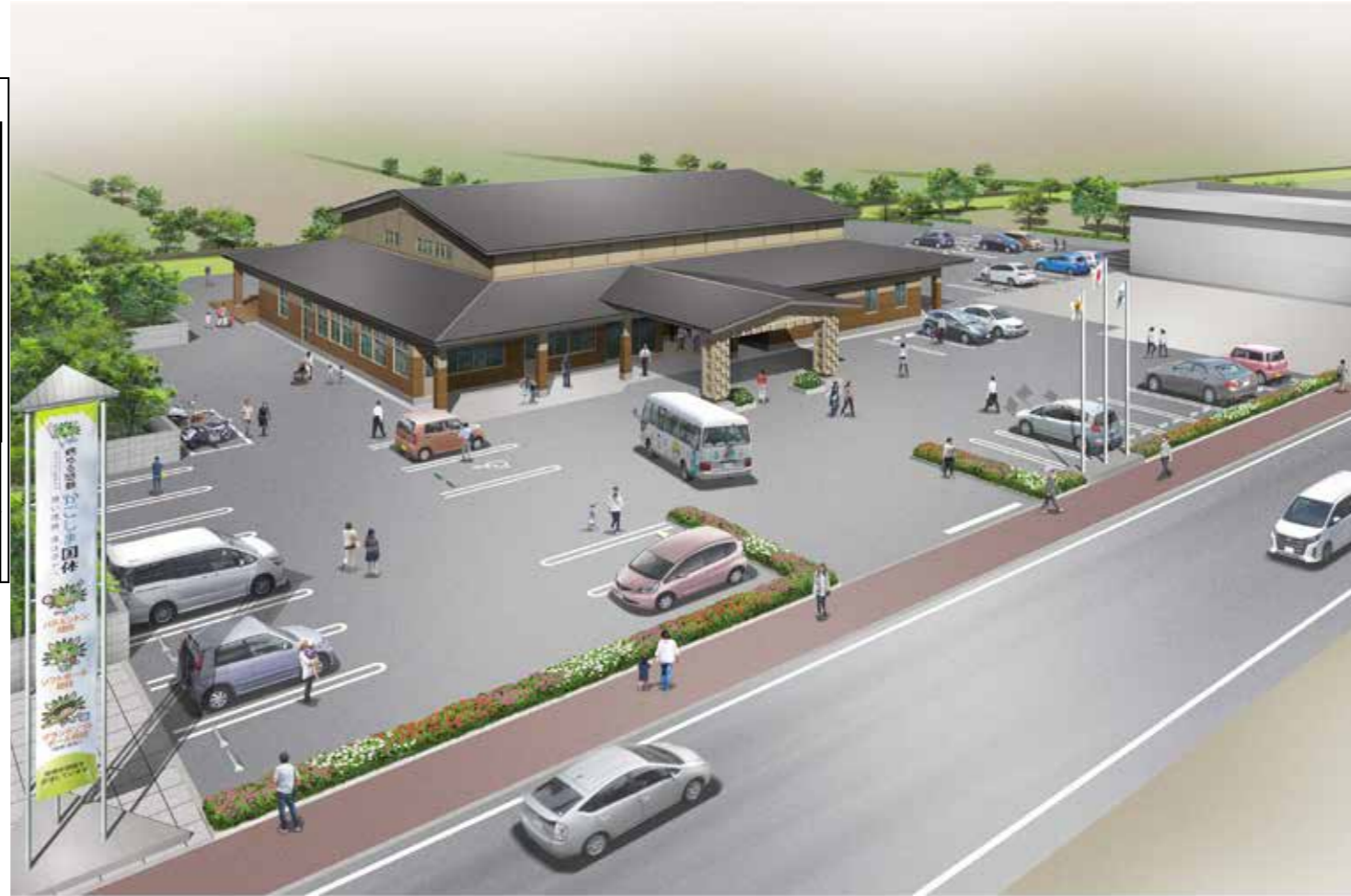
▼開聞庁舎完成イメージ

令和3年2月から工事を進めてきた新しい開聞庁舎が12月に完成します。新しい庁舎は、4つのコンセプトを軸に、設計を行いました。今回の特集では、生まれ変わった開聞庁舎を紹介します。